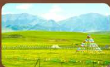
ทุ่งหญ้าออร์คอส