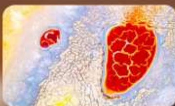
ทะเลสาบอูลาน