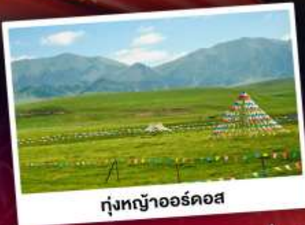
ทุ่งหญ้าออร์ดอส