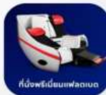
ที่นั่งพรีเิมียมเฟลตเบด