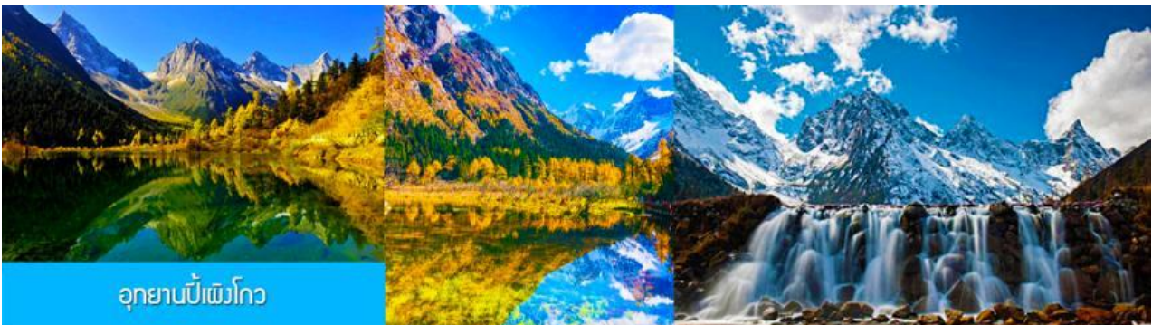
อุทยานเป่ย์ผิงโกว

หลังอาหารนำท่านเที่ยวชม อุทยานเป่ย์ผิงโกว 毕鹏沟景区 ที่เป็นแหล่งท่องเที่ยวธรรมชาติที่สวยงามได้รับฉายาว่าเป็นสวิตเซอร์แลนด์แดนใต้แห่งเมืองเสฉวน ตั้งอยู่เหนือระดับน้ำทะเลระหว่าง 2,015 เมตร – 3,500 เมตร ครอบคลุมพื้นที่ 614 ตารางกิโลเมตร ได้รับการขึ้นทะเบียนเป็นอุทยานท่องเที่ยวธรรมชาติระดับ 4A ของจีนในปี ค.ศ. 2013 และกลายเป็นอุทยานท่องเที่ยวยอดนิยมที่มีนักท่องเที่ยวเดินทางมาเยือนในปี 2023 ...นำท่านขึ้นรถบัสของอุทยานเพื่อเข้าไปยังเขตอุทยาน นำท่านขึ้นรถกอล์ฟแวะเที่ยวจุดชมวิวสำคัญต่าง ๆ ภายในเขตอุทยาน ที่ประกอบด้วย ธารน้ำแข็งและภูเขาหิมะ โอบล้อมอุทยาน ทะเลสาบที่มีสีน้ำเขียวมรกต ป่าไม้ ลำธารน้ำใสสะอาด น้ำตก ทุ่งหญ้าบนพื้นที่สูง ใบไม้เปลี่ยนสีและป่าไม้หลากสีในฤดูใบไม้ร่วง ทุ่งดอกไม้ในฤดูใบไม้ผลิ โดยมีจุด