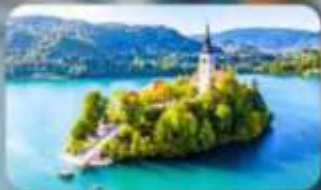
โบสถ์พระแม่มาเรียแห่งบลาด