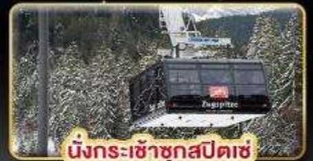
นั่งกระเช้าชุกสปีตซ์