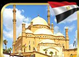
มัสยิดโอบอัมหมัดอาลี