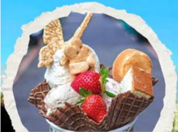
ร้านไอศกรีมมิยาซาร่า