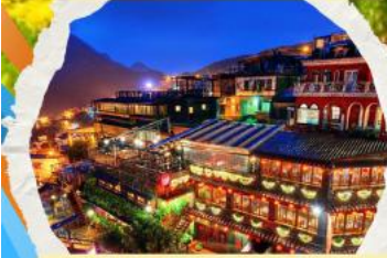
หมู่บ้านโบราณฉิวเฟิง