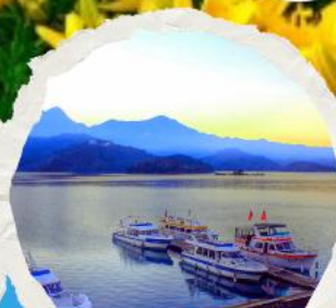
ทะเลสาบสุริยขึ้นจินทารา