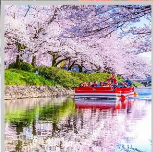
“MATSUKAWA RIVER BOAT”