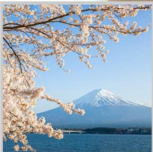
“LAKE KAWAGUCHI SAKURA”