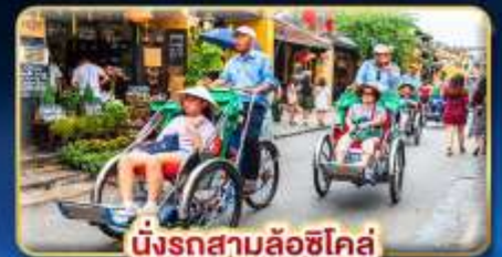
นั่งรถสามล้อฮิโค่