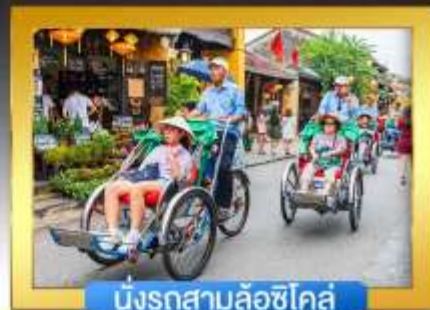
นั่งรถสามล้อซีโคล์