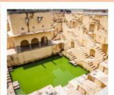
♥♥ Panna Meena