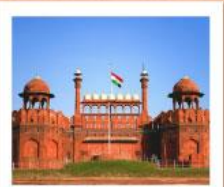
♥♥♥ Agra Fort