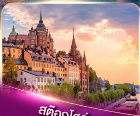
สต็อกโฮล์ม เวนิสแห่งยุโรปเหนือ