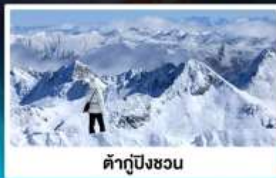
ต้าถู่ปิงชว่น