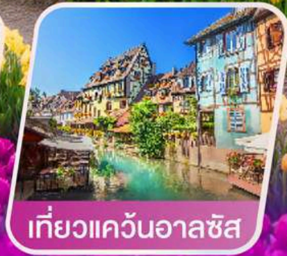
เที่ยวแคว้นอาลซัส