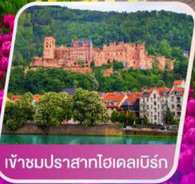
เข้าชมปราสาทไฮเดิลเบิร์ก