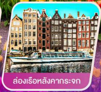
ล่องเรือหลังคากระຈก