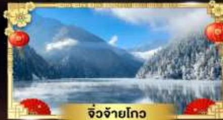
จี๋จ้ายโกว