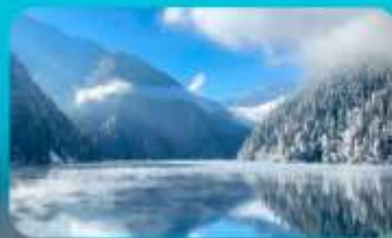
จี๋จ้ายโกว