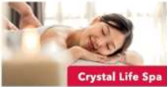
Crystal Life Spa