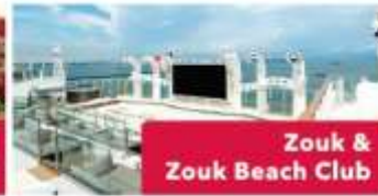
Zouk & Zouk Beach Club